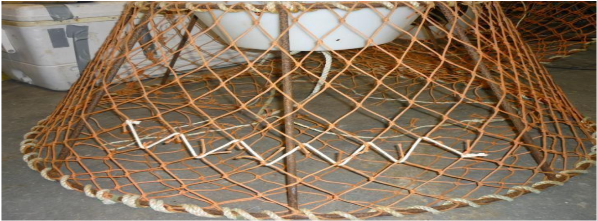
Asseq 2. Pullatit allunaasaaqqamik arrortinneqarsinnaasumik qimaaffissallip assinga. Uani allunaasaaraq nigartanut affarnut aqqaneq-marlunnut qanoq mersuunneqassanersoq takutinneqarpoq.