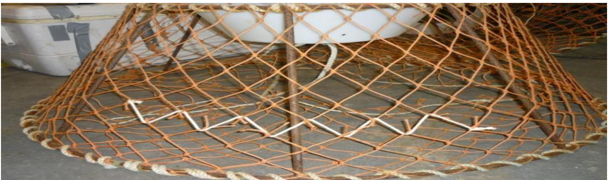
Assiliaq 2. Pullat tamakkerlugu assilisaq nigartat affaannut allunaasaq arrotinneqarsinnaasoq ikkunneqarsimasoq.