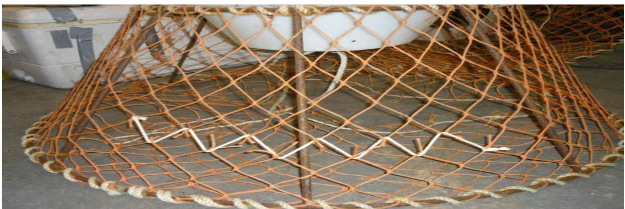
Billede 2. Fuldt billede af tejne med nedbrydeligt snor installeret, hvor den flettes ind i 12 halvmasker.